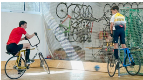
Paul mit fliegender Abwehr gegen Rothenburg.

Seit bald einem Jahr trainieren wir in der Halle an der Schellerstrasse. Die Lagermöglichkeiten für unser Material sind allerdings ungewiss. Aktuell dürfen wir ein ungenutztes Schulzimmer nutzen, mussten aber bereits einmal umziehen. Nach den Sommerferien steht erneut ein Umzug bevor – diesmal sogar in ein anderes Stockwerk. Das bedeutet: Materialtransport mit dem Lift vor jedem Training. Eine belastende Situation, für die wir dringend eine bessere Lösung suchen.