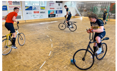
Wetzikon 2 gegen Rothenburg.