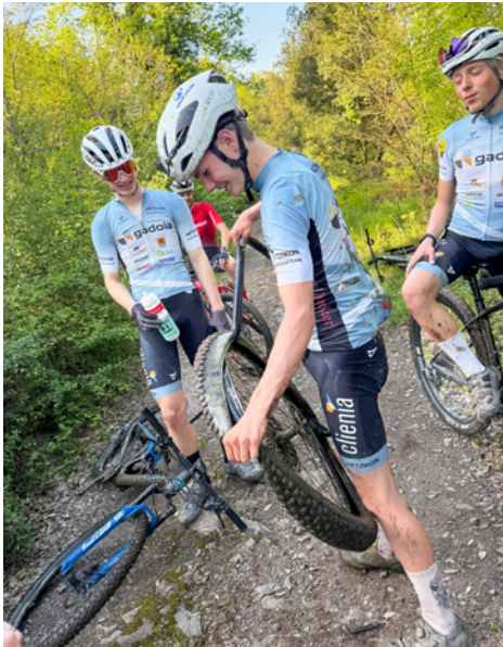
Pneu flicken in Massa Marittima.